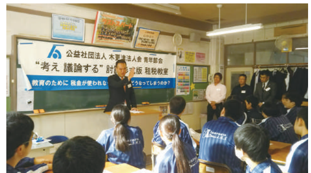
青年部会租税教室 「木更津市立木更津第二中学校」