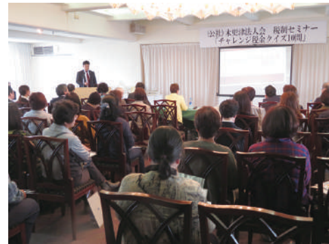
税制セミナー 「チャレンジ税金クイズ10問」