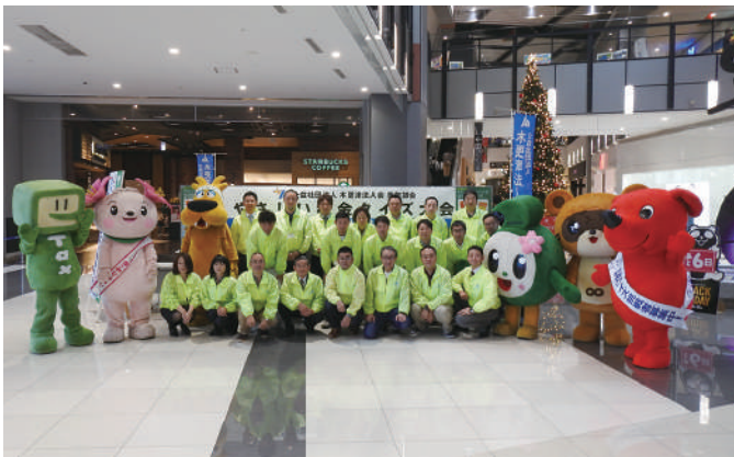
「やさしい税金クイズ大会」 イオンモール木更津