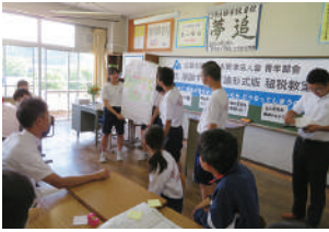
富津市立天羽中学校