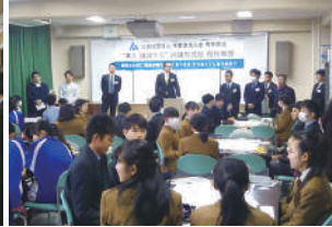
私立志学館中等部