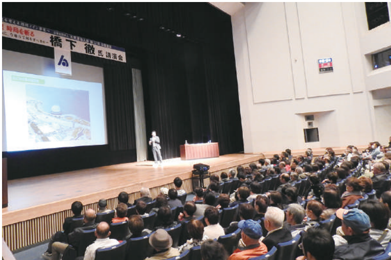
税を考える週間メイン事業 第17回公開講座 「橋下 徹氏 講演会」

発行所/公益社団法人木更津法人会 〒292-0838 木更津市潮浜1丁目17番59号 TEL.0438-37-7720 FAX.0438-37-7740 発行人/青木和義・編集/広報委員会・印刷所/アドメイクス http://www.kisarazu-houjinkai.or.jp