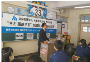
君津市立周西中学校

法人会の租税教育活動の中核とも言える「租税教室」ですが、青年部会では学校側のご要望に応じ、今年度は7月から順次開催し、かずさ四市の中学校を対象に5校19クラスに対して授業を行いました。授業スタイルは、近年特に教育界で要望の多い「アクティブラーニング」を活用し、「もし教育に税金が使われなくなったらどうなるのか?」をテーマに生徒自身が考え議論していきます。各クラス内で5～6班に分かれ、それぞれの班に青年部会員はコーディネーターとして議論を進めて結論を導き出していきます。また、青年部会員である講師が、企業経営者として税金の大切さを説いて授業を締めくりました。