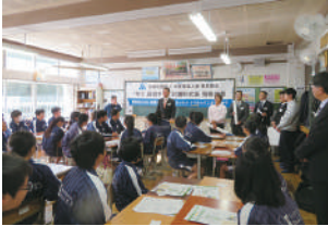
木更津市立木更津第二中学校