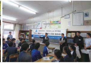
君津市立君津中学校